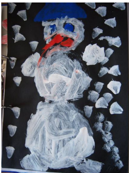
„Vyturiukų“ gr. Tito