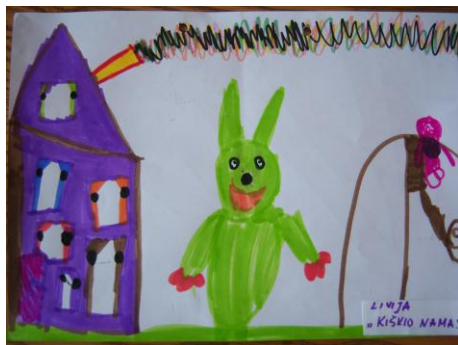
„Geniukų“ gr. Livija „Kiškio namas“

Adelė su mama parašė eilėraštuką „Žvirbliukų“ gr.